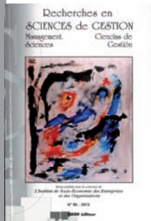
N° 96 - 246 pages FRANCAIS