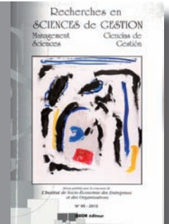
N° 95 - 242 pages FRANCAIS