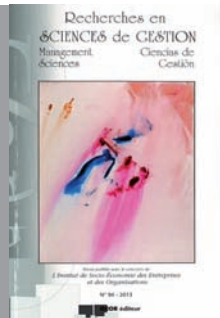
N° 94 - 200 pages FRANCAIS

. Bernard GUILLON : Un premier bilan relatif à la mesure régulière de la recherche universitaire française par les revues scientifiques francophones : 2007-2011